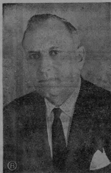
Dr. R. A. Calderón Guardia, Presidente del Partido Republicano