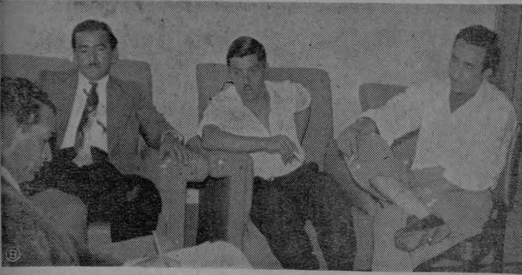
Los miembros de la comisión de vecinos de Palmar Norte que vinieron a gestionar la inclusión de la partida para el Colegio Vocacional de su localidad captados por Solano cuando realizaban su visita a las oficinas de LA PRENSA LIBRE.