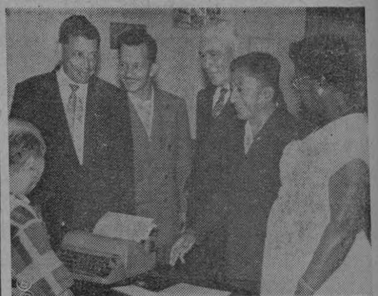
LA GRAFICA RECONE el momento en que varios vecinos de Puerto Limón le dan declaraciones a nuestro Redactor Solís Castro sobre problemas de la vida en aquella provincia.

Origen Tectónico. No se pudo apreciar debidamente la dirección de la onda sísmica ni se puede adelantar absolutamente nada sobre el epicentro del sismo.