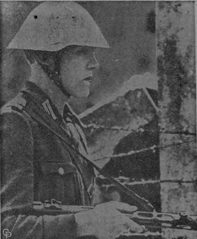
BERLIN BAJO LAS ARMAS.—Un soldado comunista luce un casco de acero mientras monta guardia cerca a una alambrada en el sector cercano a la frontera de la zona libre de Berlin para impedir que la gente continúe abandonando la Cortina de Hierro. Los Estados Unidos ha protestado del cierre de la frontera, por considerar que la misma constituye una violación al tratado firmado con la Alemania Occidental.

Otro movimiento en este mismo sentido que está bajo consideración pero que aun no ha sido decidido es despachar tropas adicionales de los Estados Unidos, Gran Bretaña y Francia a Berlin Occidental.