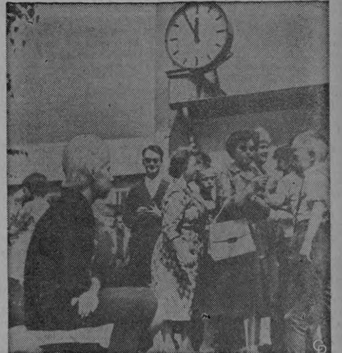
BUSCAN LA LIBERTAD.—Refugiados de la Alemania Oriental hacen filas frente al campamento Marienfelde, en Berlin Occidental, para solicitar asilo político. El temor de que los comunistas obstaculicen el éxodo de los refugiados ha hecho que diariamente millares de personas crucen la Cortina de Hierro para gozar de la libertad. La huida de estas personas ha estado afectando no solo el prestigio de la Alemania Oriental, sino también su economía.